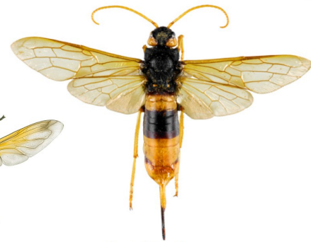
Cacynen y coed