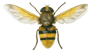
Pry hofran sy'n dynwared cacynen